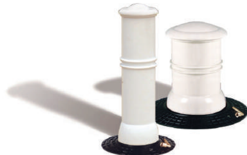
Wys. użyt. 580 mm, śr. 160 mm Nr kat. 206502