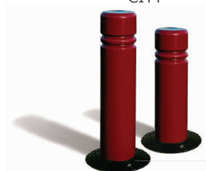
Wys. użyt. 680 mm, śr. 160 mm Nr kat. 206573